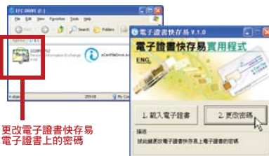
更改電子證書快存易電子證書上的密碼

4.3. 將電子證書快存易插入電腦的USB連接埠後，執行“電子證書快存易實用程式”，按“更改密碼”按鈕。