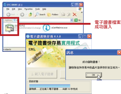
電子證書檔案成功匯入