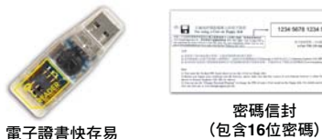
密碼信封 (包含16位密碼)

4.1. 閣下在開始更改電子證書快存易上電子證書的密碼之前，請準備以下所需物件。